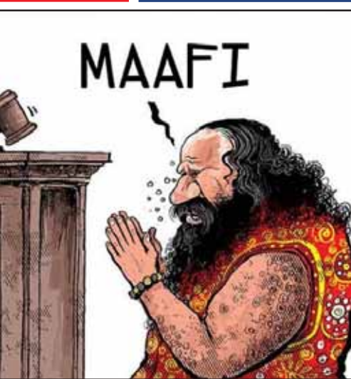
ਪੈਰੋਕਾਰ ਸੀ ਅਤੇ ਉਸ ਨੂੰ ਵੀ 2002 ਵਿੱਚ ਮਾਰਿਆ ਗਿਆ ਸੀ। ਸੀ.ਬੀ.ਆਈ. ਨੇ ਡੇਰਾ ਮੁਖੀ ਨੂੰ ਮੁੱਖ ਸਾਜ਼ਿਸ਼ਕਰਤਾ ਵਜੋਂ ਨਾਮਜ਼ਦ ਕੀਤਾ ਸੀ। ਡੇਰੇ ਨੇ ਜਾਂਚ ਵਿਰੁੱਧ ਅਪੀਲ ਕੀਤੀ ਪਰ ਸੁਪਰੀਮ ਕੋਰਟ ਨੇ ਉਹ ਖਾਰਜ ਕਰ ਦਿੱਤੀ।