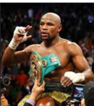
ਖੇਡਿਆ ਸੀ, ਜਦੋਂ ਉਨ੍ਹਾਂ ਨੇ ਕੋਨਰ ਮੈਕਗ੍ਰੇਗਰ ਨੂੰ ਮਾਤ ਦਿੱਤੀ ਸੀ। ਇਸ

ਲਾਸ ਏਂਜਲਸ/ਏ.ਟੀ.ਨਿਊਜ਼: ਮੁੱਕੇਬਾਜ਼ੀ ਜਗਤ ਦੇ ਦਿੱਗਜ ਖਿਡਾਰੀ ਫਲਾਇਡ ਮੇਵੇਦਰ ਨੇ ਖੇਡ ਪ੍ਰੇਮੀਆਂ ਨੂੰ ਵੱਡਾ ਤੋਹਫਾ ਦਿੰਦਿਆਂ ਪੇਸ਼ੇਵਰ ਮੁੱਕੇਬਾਜ਼ੀ ਵਿੱਚ ਵਾਪਸੀ ਦਾ ਐਲਾਨ ਕਰ ਦਿੱਤਾ ਹੈ। 9 ਸਾਲ ਪਹਿਲਾਂ ਸੰਨਿਆਸ ਲੈਣ ਵਾਲੇ ਮੇਵੇਦਰ ਨੇ ਕਿਹਾ ਹੈ ਕਿ ਉਹ ਇਸ ਸਾਲ ਗਰਮੀਆਂ ਵਿੱਚ ਮੁੜ ਰਿੰਗ ਵਿੱਚ ਉਤਰਨਗੇ। 49ਵੇਂ ਜਨਮਦਿਨ ਮੌਕੇ ਵੱਡਾ ਫੈਸਲਾ ਪਿਛਲੇ ਦਿਨੀਂ 49 ਸਾਲ ਦੇ ਹੋਏ ਮੇਵੇਦਰ ਨੇ ਆਪਣਾ ਆਖਰੀ ਪੇਸ਼ੇਵਰ ਮੁਕਾਬਲਾ ਸਾਲ 2017 ਵਿੱਚ