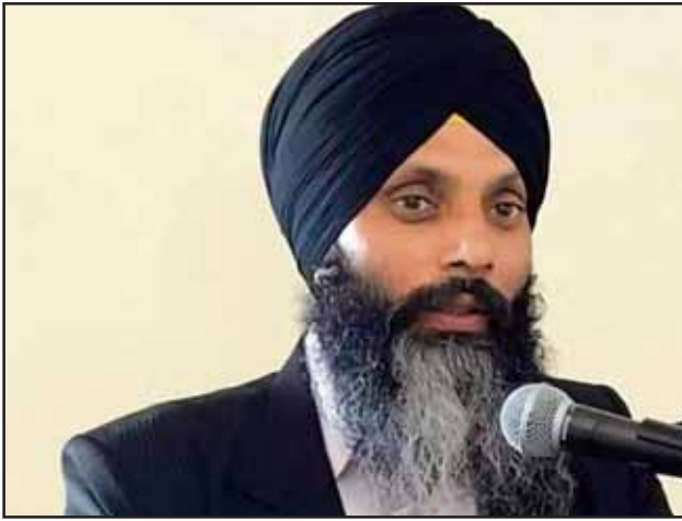
ਵਜੋਂ ਕੰਮ ਕੀਤਾ ਅਤੇ ਸਥਾਨਕ ਭਾਰਤੀ ਪ੍ਰਵਾਸੀਆਂ ਨਾਲ ਜੁੜ ਕੇ

ਰਿਪੋਰਟ ਅਨੁਸਾਰ, ਇੱਕ ਅਧਿਕਾਰੀ, ਜੋ ਕਥਿਤ ਤੌਰ 'ਤੇ ਵੀਜ਼ਾ ਅਧਿਕਾਰੀ ਸੀ, ਬਾਰੇ ਕਿਹਾ ਜਾਂਦਾ ਹੈ ਕਿ ਉਸ ਨੇ ਭਾਰਤ ਦੀ ਖ਼ੁਫ਼ੀਆ ਏਜੰਸੀ ਰਿਸਰਚ ਐਂਡ ਐਨਾਲਿਸਿਸ ਵਿੰਗ (ਰਾਅ) ਲਈ ਇੱਕ ਗੁਪਤ ਏਜੰਟ