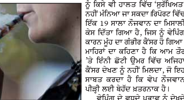
ਨੂੰ ਕਿਸੇ ਵੀ ਹਾਲਤ ਵਿੱਚ 'ਸੁਰੱਖਿਅਤ' ਨਹੀਂ ਮੰਨਿਆ ਜਾ ਸਕਦਾ। ਰਿਪੋਰਟ ਵਿੱਚ ਇੱਕ 19 ਸਾਲਾ ਨੌਜਵਾਨ ਦਾ ਮਿਸਾਲੀ ਕੇਸ ਦਿੱਤਾ ਗਿਆ ਹੈ, ਜਿਸ ਨੂੰ ਵੇਪਿੰਗ ਕਾਰਨ ਮੂੰਹ ਦਾ ਗੰਭੀਰ ਕੈਂਸਰ ਹੋ ਗਿਆ। ਮਾਹਿਰਾਂ ਦਾ ਕਹਿਣਾ ਹੈ ਕਿ ਆਮ ਤੌਰ 'ਤੇ ਇੰਨੀ ਛੋਟੀ ਉਮਰ ਵਿੱਚ ਅਜਿਹਾ ਕੈਂਸਰ ਦੇਖਣ ਨੂੰ ਨਹੀਂ ਮਿਲਦਾ, ਜੋ ਇਹ ਸਾਬਤ ਕਰਦਾ ਹੈ ਕਿ ਵੇਪ ਨੌਜਵਾਨ ਪੀੜ੍ਹੀ ਲਈ ਬੇਹੱਦ ਖ਼ਤਰਨਾਕ ਹੈ। ਵੇਪਿੰਗ ਦੇ ਵਧਦੇ ਪ੍ਰਭਾਵ ਨੂੰ ਦੇਖਦੇ ਹੋਏ ਬ੍ਰਿਟੇਨ ਵਰਗੇ ਦੇਸ਼ਾਂ ਨੇ ਡਿਸਪੋਜੇਬਲ ਵੇਪ 'ਤੇ ਪਾਬੰਦੀ ਲਗਾਉਣ ਵਰਗੇ ਸਖ਼ਤ ਕਦਮ ਚੁੱਕਣੇ ਸ਼ੁਰੂ ਕਰ ਦਿੱਤੇ ਹਨ। ਖੋਜਕਰਤਾਵਾਂ ਦੀ ਸਲਾਹ ਹੈ ਕਿ ਲੋਕਾਂ ਨੂੰ ਵੇਪਿੰਗ ਨੂੰ ਸਿਗਰਟ ਛੱਡਣ ਦੇ ਤਰੀਕੇ ਵਜੋਂ ਨਹੀਂ ਦੇਖਣਾ ਚਾਹੀਦਾ, ਕਿਉਂਕਿ ਇਹ ਖੁਦ ਇੱਕ ਜਾਨਲੇਵਾ ਆਦਤ ਹੈ।