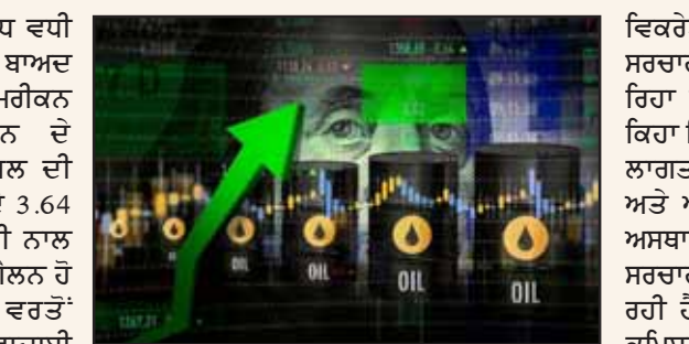
ਦਿੱਗਜ ਐਮਾਜ਼ਾਨ ਨੇ ਇਹ ਵੀ ਕਿਹਾ ਹੈ ਕਿ ਉਹ 17 ਅਪ੍ਰੈਲ ਤੋਂ ਥਰਡ-ਪਾਰਟੀ ਹੋਵੇਗਾ ਅਤੇ 17 ਜਨਵਰੀ 2027 ਤੱਕ ਲਾਗੂ

ਮੁਕਾਬਲੇ ਇੱਕ ਡਾਲਰ ਤੋਂ ਵੱਧ ਵਧੀ ਹੈ ਅਤੇ ਅਗਸਤ 2022 ਤੋਂ ਬਾਅਦ ਦਾ ਸਭ ਤੋਂ ਉੱਚਾ ਪੱਧਰ ਹੈ। ਅਮਰੀਕਨ ਆਟੋਮੋਬਾਈਲ ਐਸੋਸੀਏਸ਼ਨ ਦੇ ਅੰਕੜਿਆਂ ਅਨੁਸਾਰ, ਡੀਜ਼ਲ ਦੀ ਕੀਮਤ ਇੱਕ ਸਾਲ ਪਹਿਲਾਂ ਦੇ 3.64 ਡਾਲਰ ਪ੍ਰਤੀ ਗੈਲਨ ਤੋਂ ਤੇਜ਼ੀ ਨਾਲ ਵਧ ਕੇ 5.53 ਡਾਲਰ ਪ੍ਰਤੀ ਗੈਲਨ ਹੋ ਗਈ ਹੈ। ਡੀਜ਼ਲ ਦੀ ਵਰਤੋਂ ਖੇਤੀਬਾੜੀ, ਉਸਾਰੀ ਅਤੇ ਆਵਾਜਾਈ ਦੇ ਨਾਲ-ਨਾਲ ਹੋਰ ਉਦਯੋਗਾਂ ਵਿੱਚ ਵੱਡੇ ਪੱਧਰ 'ਤੇ ਕੀਤੀ ਜਾਂਦੀ ਹੈ। ਈ-ਕਾਮਰਸ