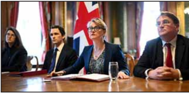
ਸਪਲਾਈ ਪ੍ਰਭਾਵਿਤ ਹੋਈ ਹੈ।

ਨਵੀਂ ਦਿੱਲੀ/ਏ.ਟੀ.ਨਿਊਜ਼: ਹਰਮੁਜ਼ ਜਲਮਾਰਗ ਮੁੜ ਖੋਲ੍ਹਣ ਲਈ ਪਿਛਲੇ ਦਿਨੀਂ ਬਰਤਾਨੀਆ ਦੀ ਮੈਜ਼ਬਾਨੀ ਵਿੱਚ ਹੋਈ 60 ਮੁਲਕਾਂ ਦੀ ਸਿਖਰ ਵਾਰਤਾ ਵਿੱਚ ਭਾਰਤ ਨੇ ਪੱਛਮੀ ਏਸ਼ੀਆ ਵਿਚਲਾ ਤਣਾਅ ਘਟਾਉਣ 'ਤੇ ਜ਼ੋਰ ਦਿੱਤਾ। ਭਾਰਤ ਨੇ ਕਿਹਾ ਕਿ ਇਸ ਸੰਕਟ ਕਰਕੇ ਕੁੱਲ ਆਲਮ ਨੂੰ ਮਨੁੱਖੀ ਤੇ ਰਣਨੀਤਕ ਕੀਮਤ ਤਾਰਨੀ ਪੈ ਰਹੀ ਹੈ। ਬੈਠਕ ਵਿੱਚ ਭਾਰਤ ਦੀ ਨੁਮਾਇੰਦਗੀ ਕਰਦਿਆਂ ਵਿਦੇਸ਼ ਸਕੱਤਰ ਵਿਕਰਮ ਮਿਸ਼ਰੀ ਨੇ ਕਿਹਾ ਕਿ ਭਾਰਤ ਇਕੋ ਇਕ ਮੁਲਕ ਹੈ, ਜਿਸ ਦੇ ਮਲਾਹ ਖਾੜੀ ਵਿੱਚ ਮਰਚੈਂਟ ਬੇੜਿਆਂ 'ਤੇ ਹੋਏ ਹਮਲੇ ਦੌਰਾਨ ਮਾਰੇ ਗਏ ਸਨ। ਉਨ੍ਹਾਂ ਖਿੱਤੇ ਵਿੱਚ ਕੌਮਾਂਤਰੀ ਬੇੜਿਆਂ ਦੀ ਸੁਰੱਖਿਆ ਬਾਰੇ ਨਵੀਂ ਦਿੱਲੀ ਦਾ ਸਟੈਂਡ ਰੱਖਿਆ।